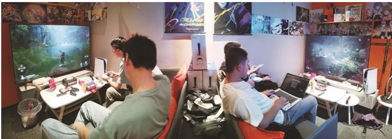
燥玩星球主机游戏店内,玩家体验《黑神话:悟空》。

“游戏将许多国人熟悉的古建筑元素作为场景设计,让观众跟随镜头仿佛置身千年之前,主创团队用充满诗意的美学元素,在游戏世界里铺陈开一