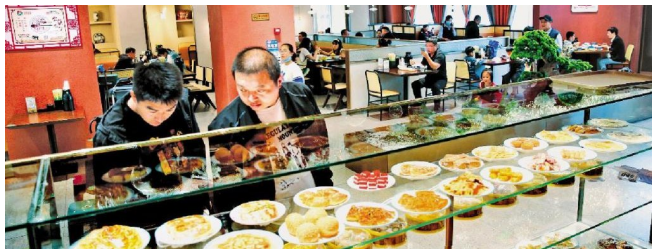
吴忠早茶店里品种丰富的小吃供顾客选择。