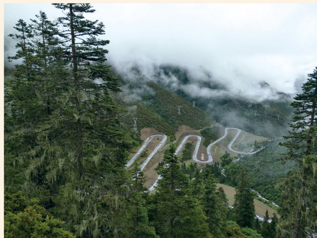
《古道幽静》 摄影类二等奖 同心县机关事务服务中心 马科