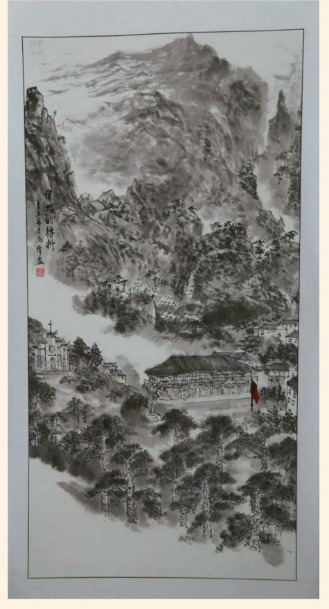
《遵义会议——伟大的转折》 绘画类二等奖 灵武市机关事务服务中心 马伟