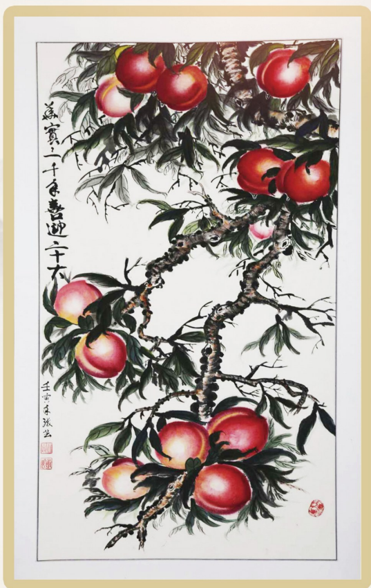
《华实三千年 喜迎二十大》